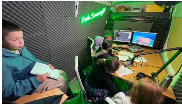
Ferienpass Grenchen: Abenteuer Radio im Studiobus des Jugendradios Sommernight.

Das Wetter war dem Grenchner Ferienpass an diesem Tag nicht freundlich gesinnt. Es regnete praktisch den ganzen Tag. Das hatte zur Folge, dass der Bus des Jugendradios Sommernight auf dem Zeitplatz praktisch den ganzen Tag geschlossen blieb und die Kids im Innern des Fahrzeugs von den wenigen Passanten in der Fussgängerzone bei dem Hudelwetter gar nicht erst bemerkt wurden.