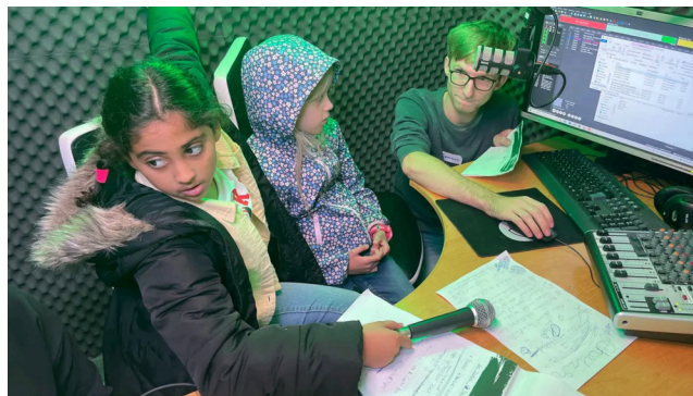
Ferienpass Grenchen: Abenteuer Radio.

Doch das war an diesem Tag schlecht möglich. Kam dazu, dass beim Netzwerk im Ebosa-Areal zuerst noch nach einem freien Raum gesucht werden musste, weil die Reservierung für einen Raum, in dem die Recherchen gemacht und Beiträge vorbereitet werden, irgendwie unters Eis geraten war.