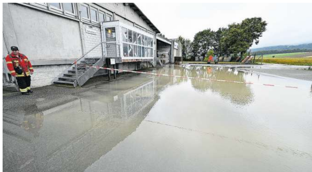
Vor dem Baubedarf in der Witi hat sich ein regelrechter See gebildet, der Keller lief voll.

Beim Bauernhof südlich des Pumptrack lief ebenfalls Wasser in den Keller des Wohnhauses. Auch dort musste die Feuerwehr